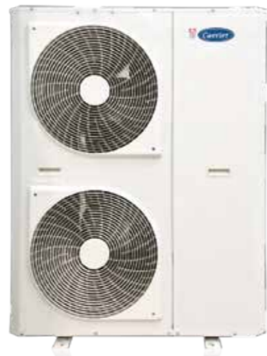
5~10HP 转子压缩机 单压缩机 双风扇