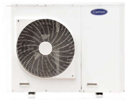
1.5~4HP 转子压缩机 单压缩机 单风扇