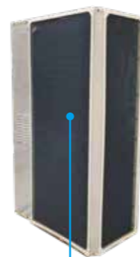
磁吸防尘网 一键清洗，节省人工